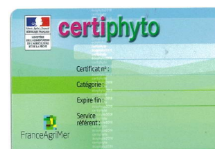
Figure 2 la face verso du Certiphyto

Plusieurs certificats ont été définis, selon l'activité du professionnel. Ils peuvent être obtenus par la formation et/ou par un test de connaissances.